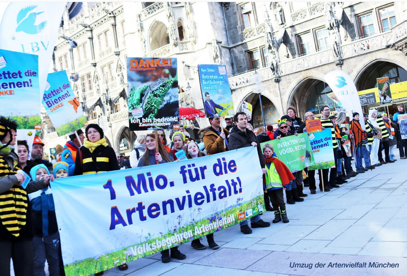
Umzug der Artenvielfalt München

Unter Leitung des Landtagspräsidenten a.D. Alois Glück tagt der von der Staatsregierung eingesetzte „Runde Tisch“ mit zahlreichen VertreterInnen der Landwirtschafts- und Umweltverbände sowie Fachleuten aus Wissenschaft und Verwaltung.